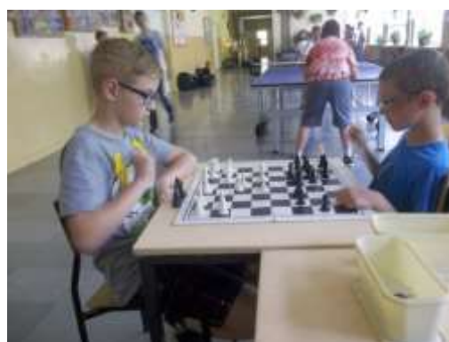
KORYTARZE I i II PIĘTRA