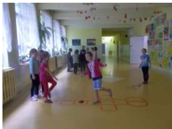
KORYTARZ NA PARTERZE