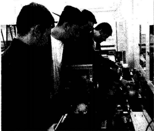
Tlmačskí študenti sú už tradične úspešní aj na medzinárodných stážach.

ale aj zručnosti. Aj vďaka tomu sú o ďalší krok vpred pred ich rovesníkmi. „Veľmi častou požiadavkou súčasných zamestnávateľov, ktorí spolupracujú nielen s našou školou, je zvýšiť odbornú pripravenosť absolventov odborných škôl na programovanie a obsluhu CNC obrábacích strojov a zariadení, či ob-