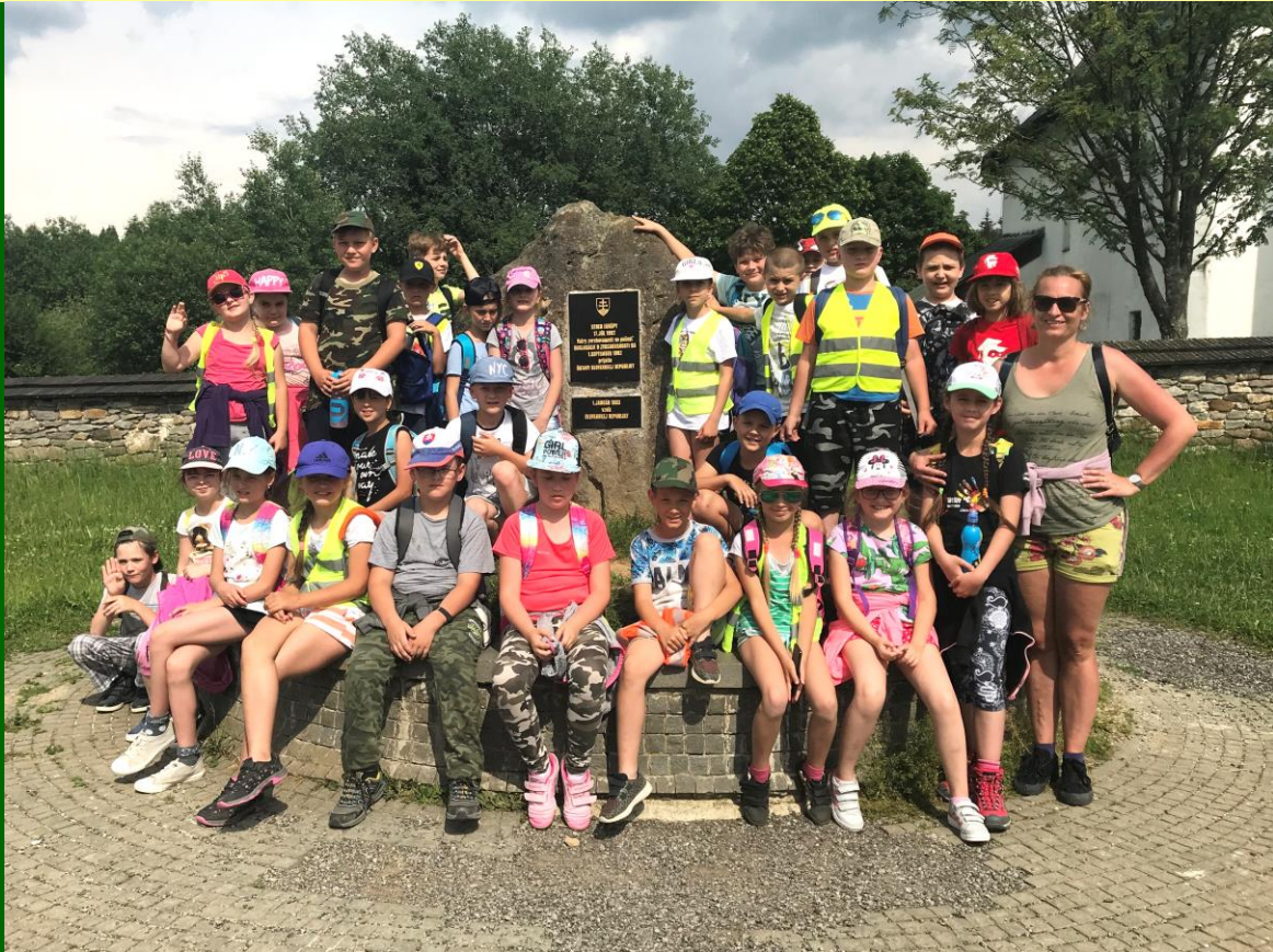
Z výletu do stredu Európy