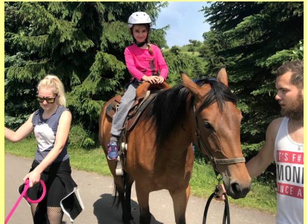
Remeslá - strelba z luku, jazdectvo