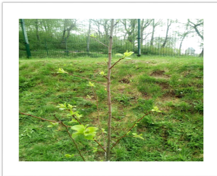
Szkolne drzewo owocowe.