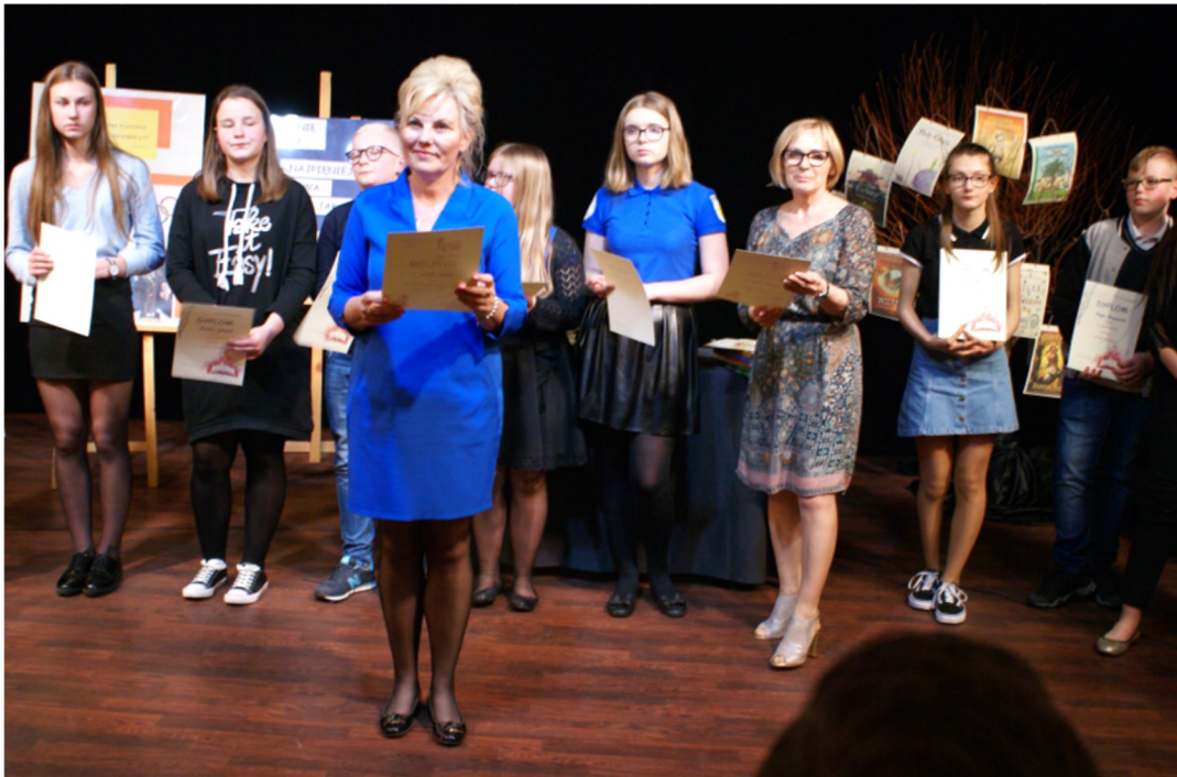
Mistrzowie pięknego czytania w konkursie międzyszkolnym