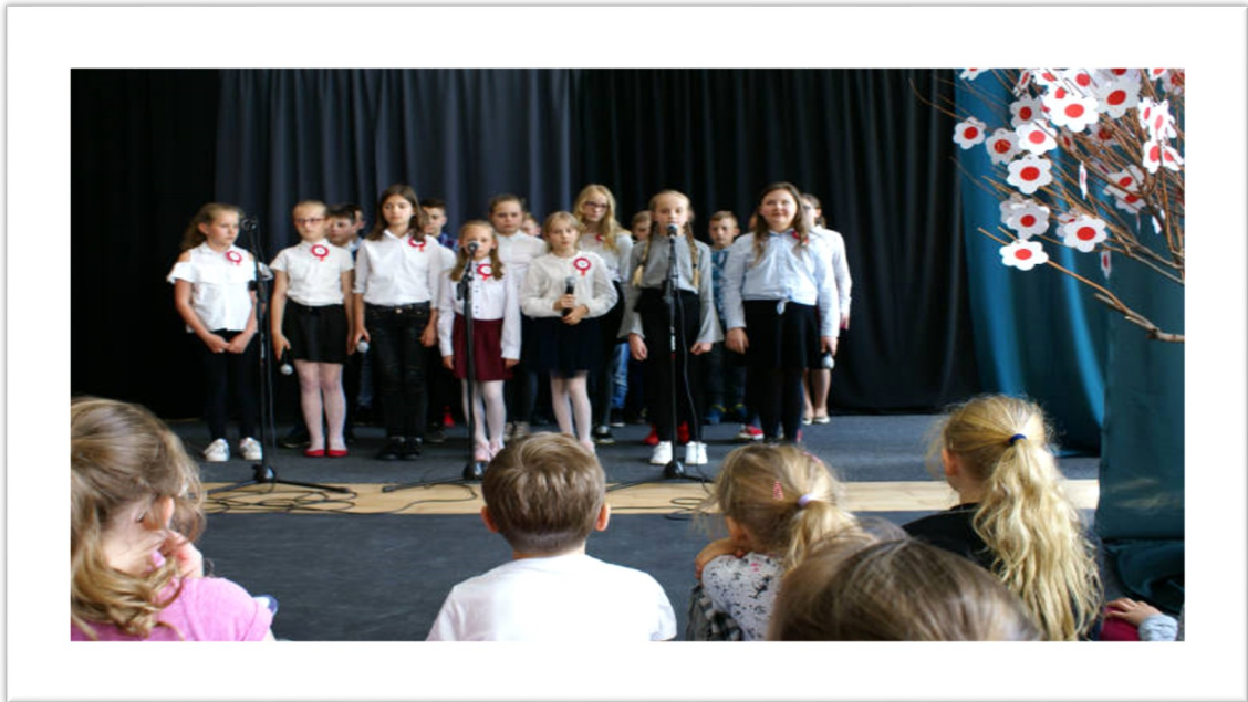
Święto Trzeciego Maja