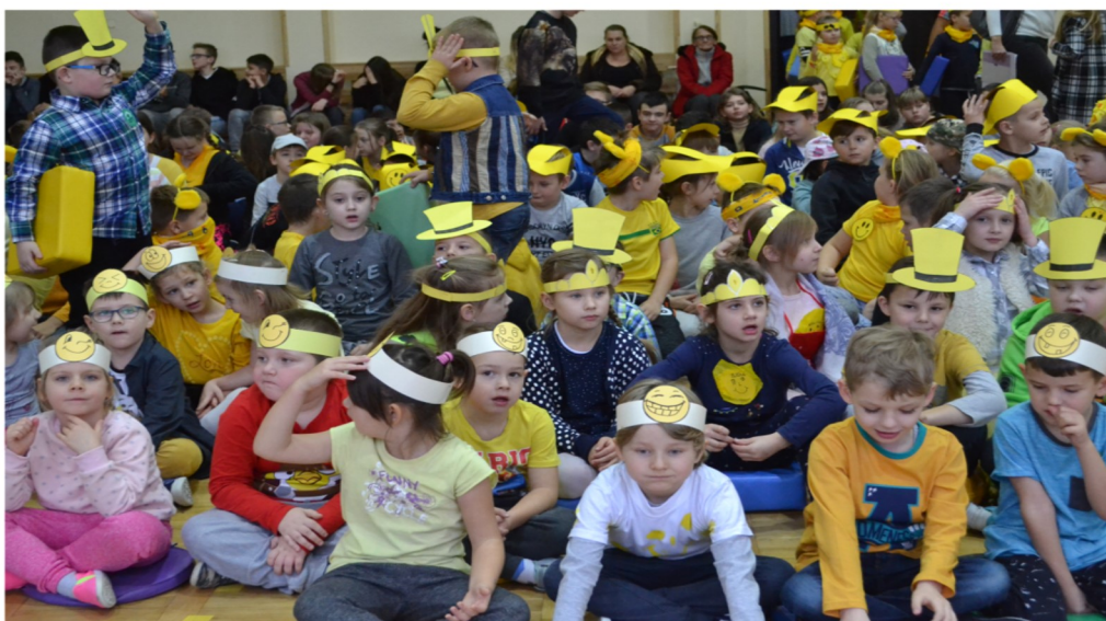
Wiwat na cześć nowych władców