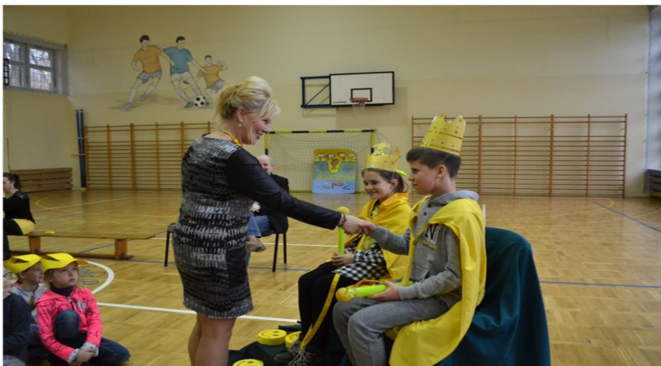
Król i Królowa Życzliwości