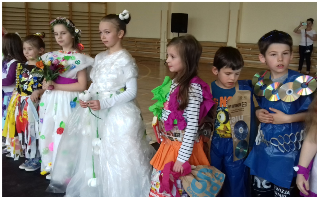
Kreacje z pokazu EKO-MODY