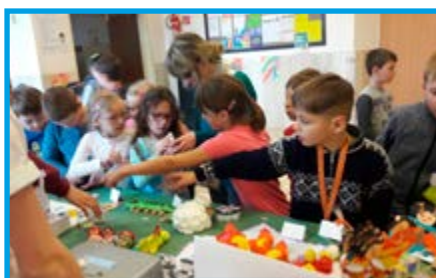
Veľkonočná burza ŠKD.