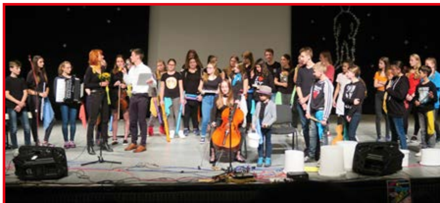
Vystúpenie v súťaži Orava má talent.