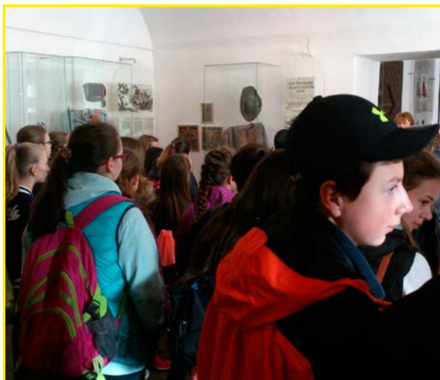
Exkurzia v Múzeu Janka Kráľa v Liptovskom Mikuláši.