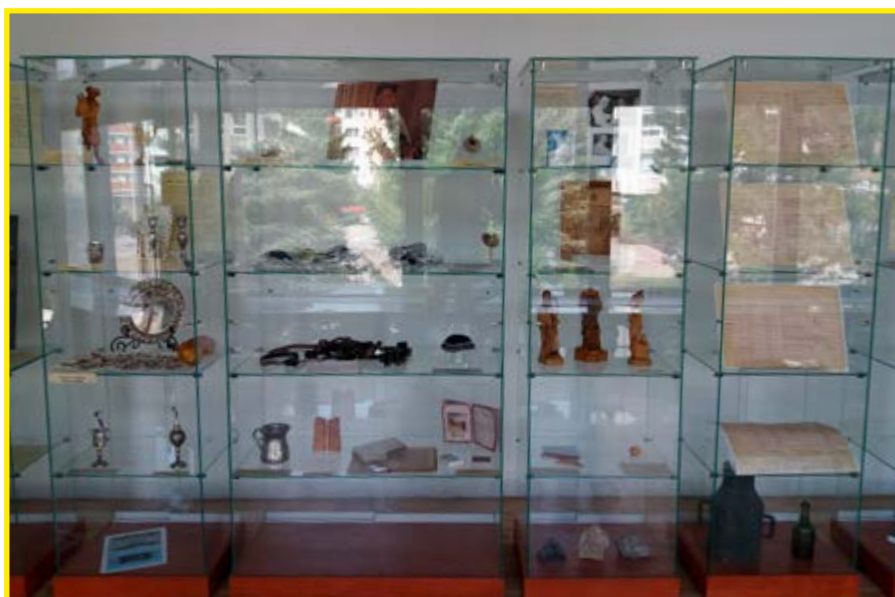
Expozícia v MsKS v Dolnom Kubíne.