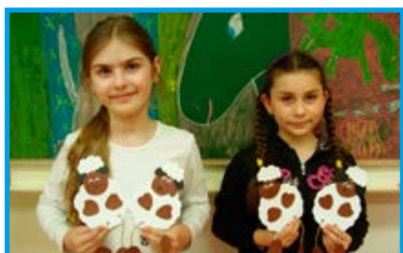
Výroba veľkonočných dekorácií a ozdôb v ŠKD.