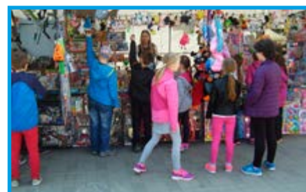
Návšteva Veľkonočných trhov na Bysterci.