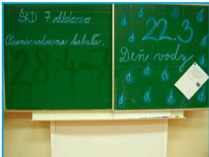
Svetový deň vody - 22. marec.

22. marec je vyhlásený za Svetový deň vody. Určite všetci vieme, že pre život človeka je voda najdôležitejšia tekutina. Je neoddeliteľnou súčasťou nášho života.