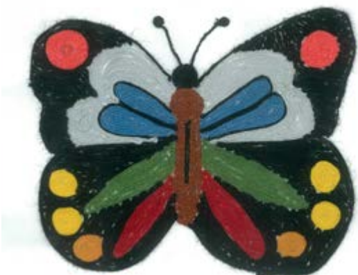
Michal Zápotočný, 6.B