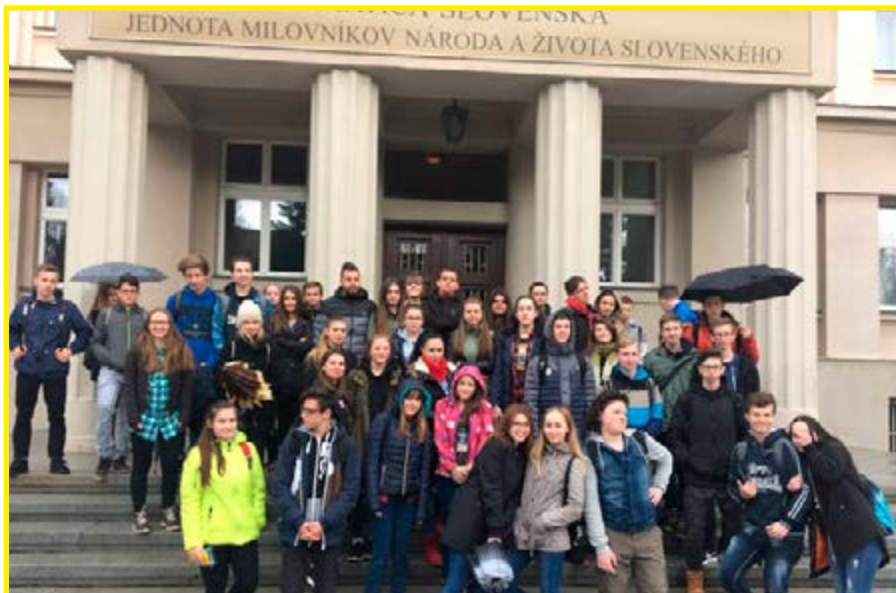
Deviataci na exkurzii v Matici slovenskej v Martine.

oboznamovať verejnosť so slovenskou históriou, kultúrou a tradíciami. Taktiež sa snaží žiakom a študentom priblížiť slovenskú literatúru a jej predstaviteľov. Plánovali sme navštíviť aj Slovenský národný cintorín, ale kvôli nepriaznivému počasiu sa nám to nepodarilo. Aj napriek tomu sme sa dozvedeli veľa pozoruhodných informácií. Exkurzia nám priniesla veľa nových a zaujímavých poznatkov. Sme veľmi radi, že sme sa jej mohli zúčastniť.