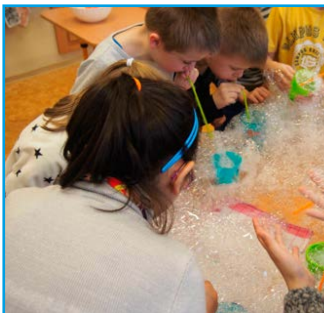
Čarovanie s vodou.