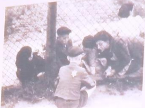
(Geto v Lodži pre deti, chorých a starých)