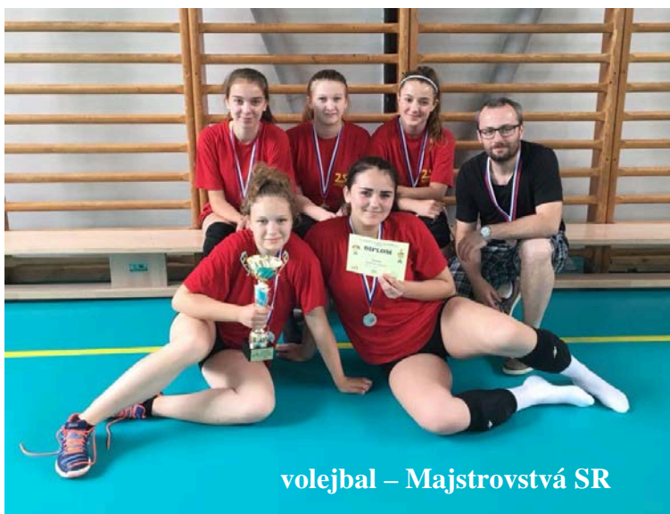
volejbal – Majstrovstvá SR